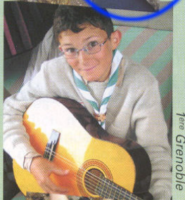
1 ère Grenoble