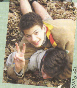
15 e Paris